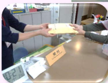
フロントサービス