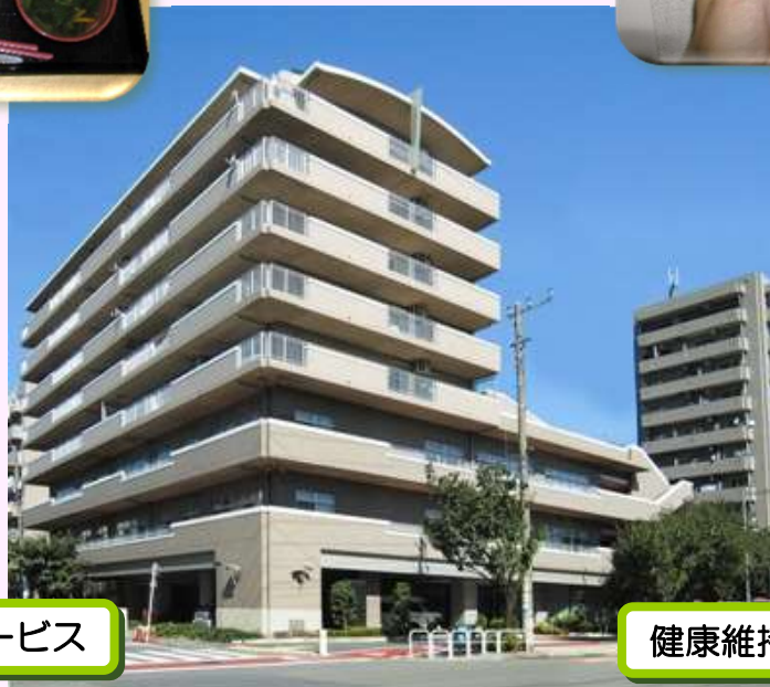
フロントサービス